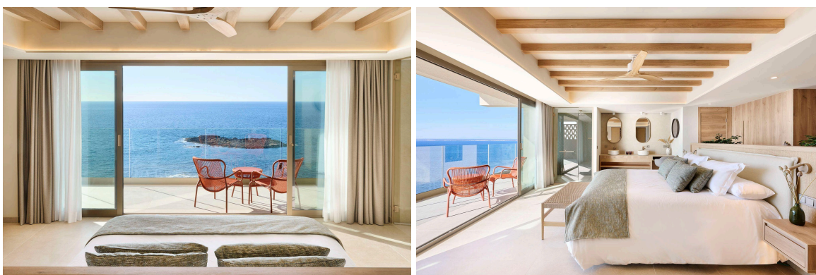
Detalles de las habitaciones en Iberostar Selection Es Trenc.