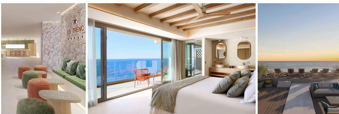
Detalle del hall, vistas al mar desde las habitaciones e imagen renderizada del rooftop en Iberostar Selection Es Trenc.